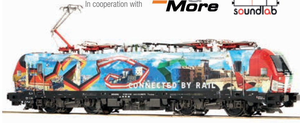
Handmuster